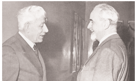
Ferruccio Parri (1890-1981) e Ernesto Rossi (1897-1967)